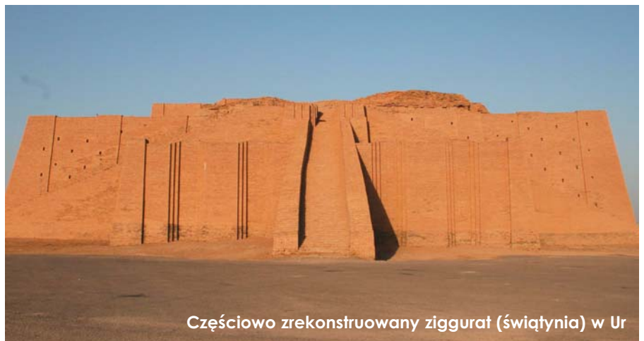
Częściowo zrekonstruowany ziggurat (świątynia) w Ur

Z tekstów medycznych jasno wynika, że Babilończycy nie mieli rozległej