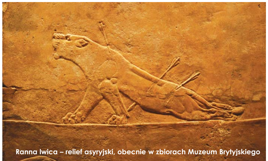
Ranna lwica – relief asyryjski, obecnie w zbiorach Muzeum Brytyjskiego