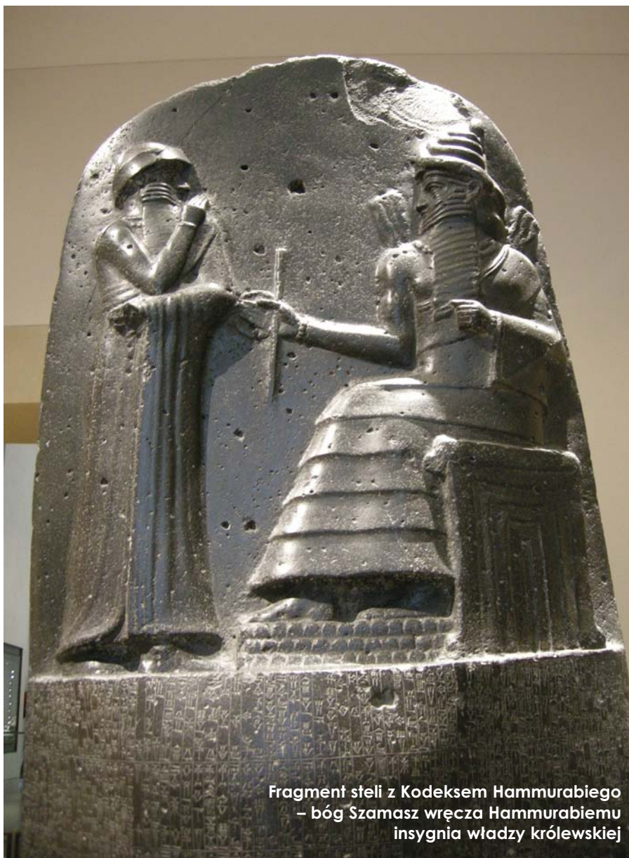
Fragment steli z Kodeksem Hammurabiego – bóg Szamasz wręcza Hammurabiemu insygnia władzy królewskiej

Osiągnięcia starożytnych mieszkańców doliny Tygrysu i Eufratu to nie tylko spektakularne budownictwo sakralne (ceglane zigguraty), wynalazek koła, system nawadniania pól uprawnych oraz zaawansowana matematyka (w tym wprowadzenie sześćdziesiątkowego systemu liczbowego) i astronomia, ale również pierwociny medycyny, mocno jeszcze związanej z rytuałami magicznymi i politeistycznymi wierzeniami, oraz wyodrębnienie się z kasty kapłańskiej zawodu lekarza.