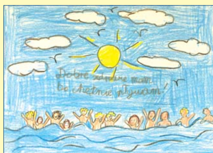
Kacper Koczvara, kl. 3, SP nr 155