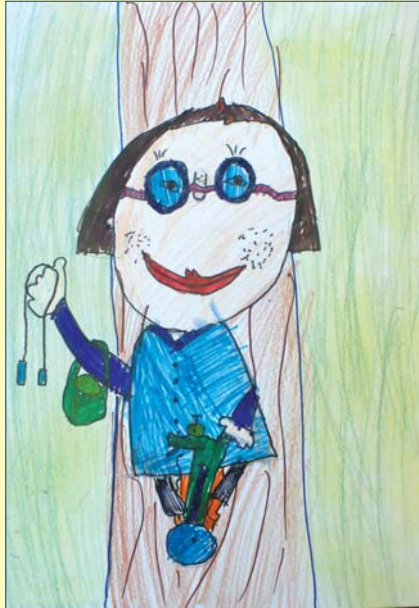
Malwina Kubicka, kl. 2A, SP nr 68