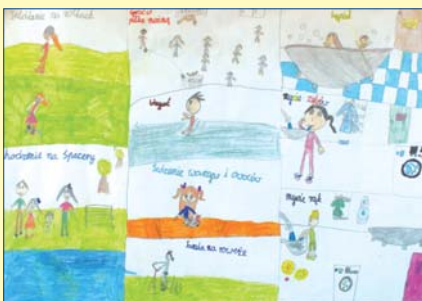
Maja Kozioł, kl. 2A, SP nr 209