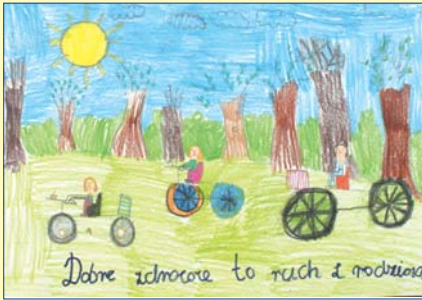
Róża Antoniuk, kl. 2, SP nr 155