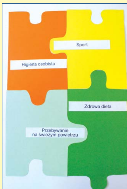
Iwo Wójcik, kl. 3C, SP nr 267 nr 267