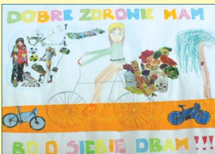
Paulina Olszak, kl. 2A, SP nr 92