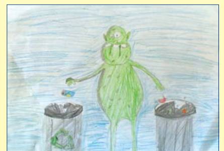
Mateusz Tański, kl. 2B, SP nr 53