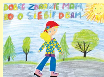
Bogumiła Juszczyk, kl. 3C, SP nr 267