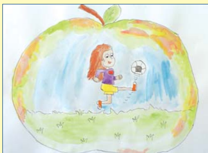
Pola Mularczyk, kl. 3B, SP nr 289