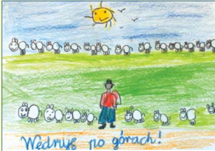
Paweł Urbaniak, kl. 2, SP nr 155