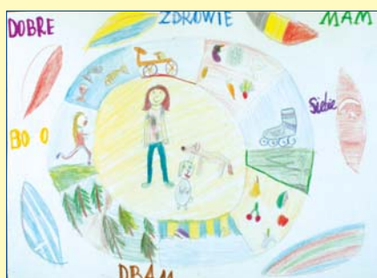
Maja Kotlicka, kl. 2B, SP nr 68