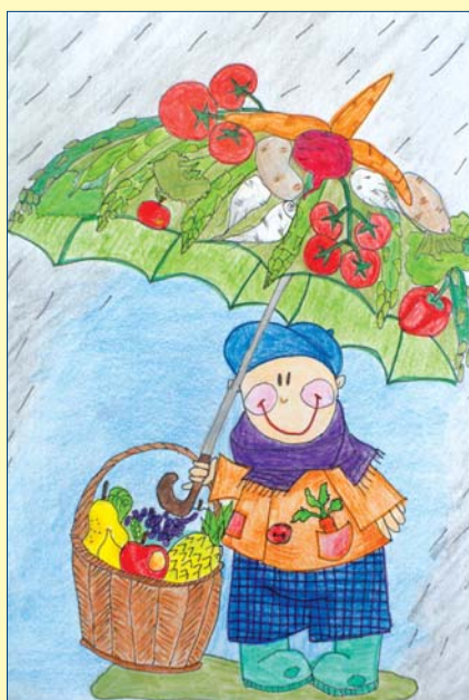
Jakub Polkowski, kl. 3C, SP nr 267