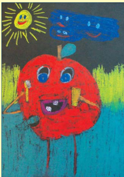
Emilia Martyniuk, kl. 2C, SP nr 92