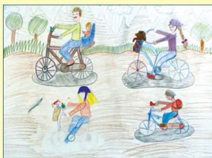
Wiktoria Stachura, kl. 3C, SP 267