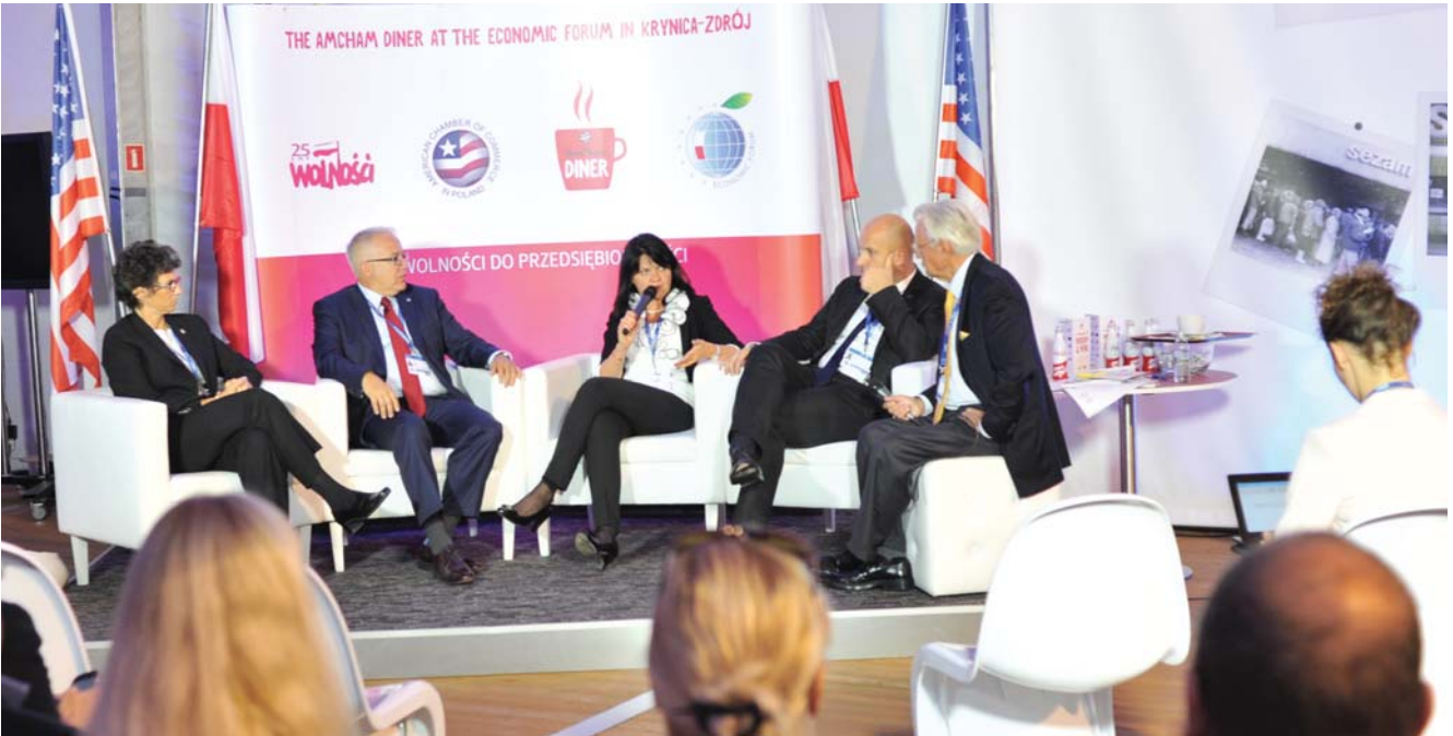
Polsko-amerykańska dyskusja na temat „Drogi wolności do przedsiębiorczości”

w czasach zwiększonej zachorowalności na choroby cywilizacyjne, w tym nowotwory.