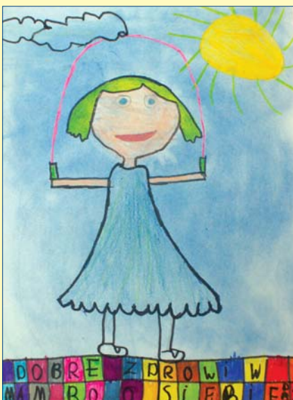
Maja Siadek, kl. 2A, SP nr 68