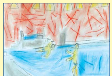
Szymon Wachnik, kl. 2A, SP nr 53