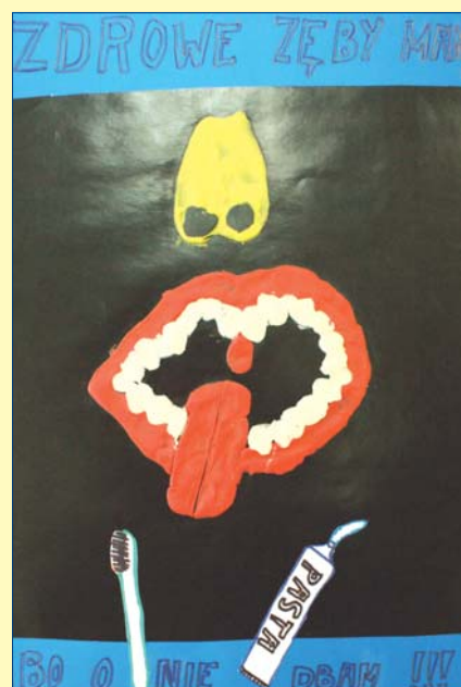
Emilia Sikora, kl. 3A, SP nr 273