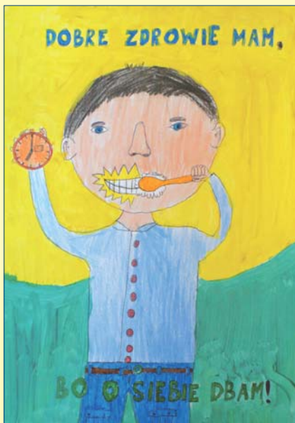
Wiktor Szczepański, kl. 2A, SP nr 68

Prace na nasz konkurs „Dobre zdrowie mam, bo o siebie dbam”, organizowany przez SPZZLO Warszawa-Żoliborz, nadstali uczniowie żoliborsko-bieleńskich szkół podstawowych i gimnazjów.